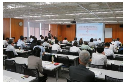
昨年度の様子(静岡会場)